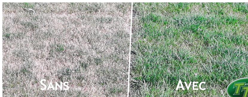
Ray-grass classique (à gauche) vs TT (à droite), tolérance au sec

Les ray-gras TT augmentent la tolérance au sec et la densité de l'engazonnement. Leur implantation rapide compense la vitesse d'installation un peu plus lente de la micro-luzerne.